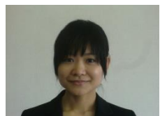
養護 更科 育