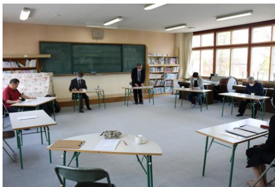
「第1回 コミュニティ・スクール協議会」の様子